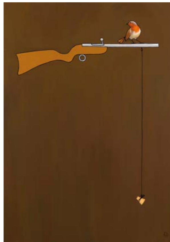
Seguint un estel fugaç (Oli sobre tela, 162x114 cm.)

No importa com siga d'estreta la reixa, com de càstigs feixuc el pergamí: sóc mestre del meu destí, sóc el capità de l'anima meua.