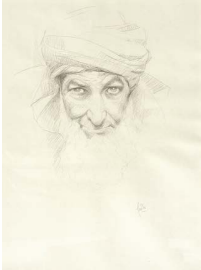
Primer esborrany de l'obra Hassan