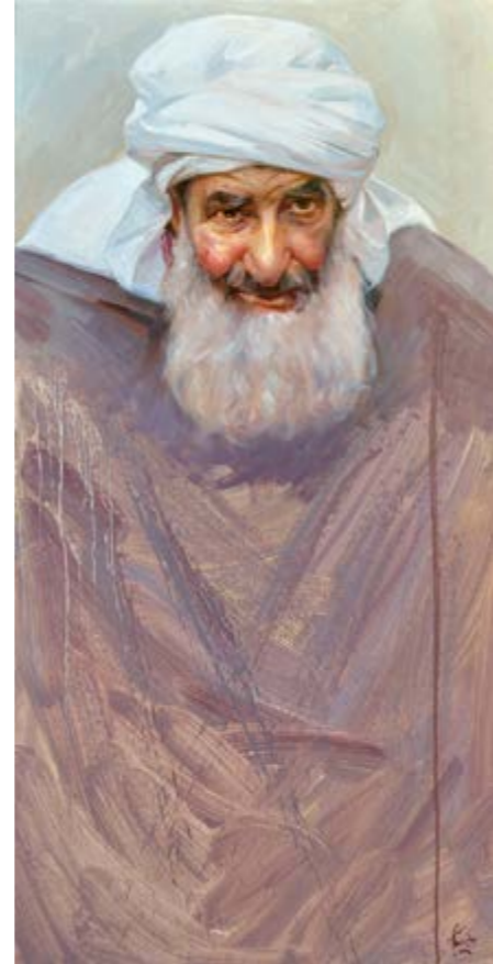
Hassan (Oli sobre tela, 100x50 cm.)