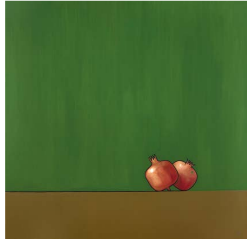
Els teus llavis (Oli sobre tela, 150x150 cm.)

«Això, cap a on anàvem en tot aquell camí, cap a la Naixença o la Mort?»