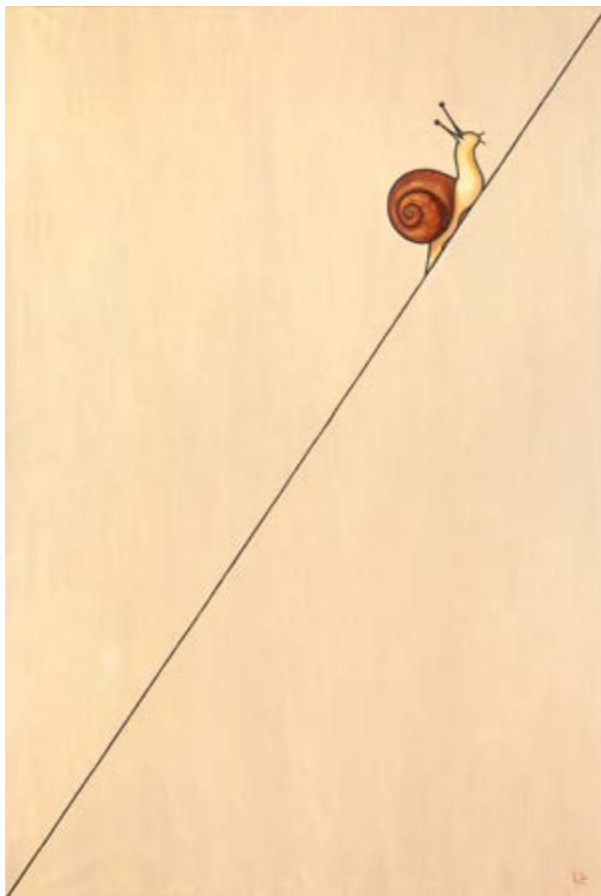
No importa (Oli sobre tela, 195x130 cm.)