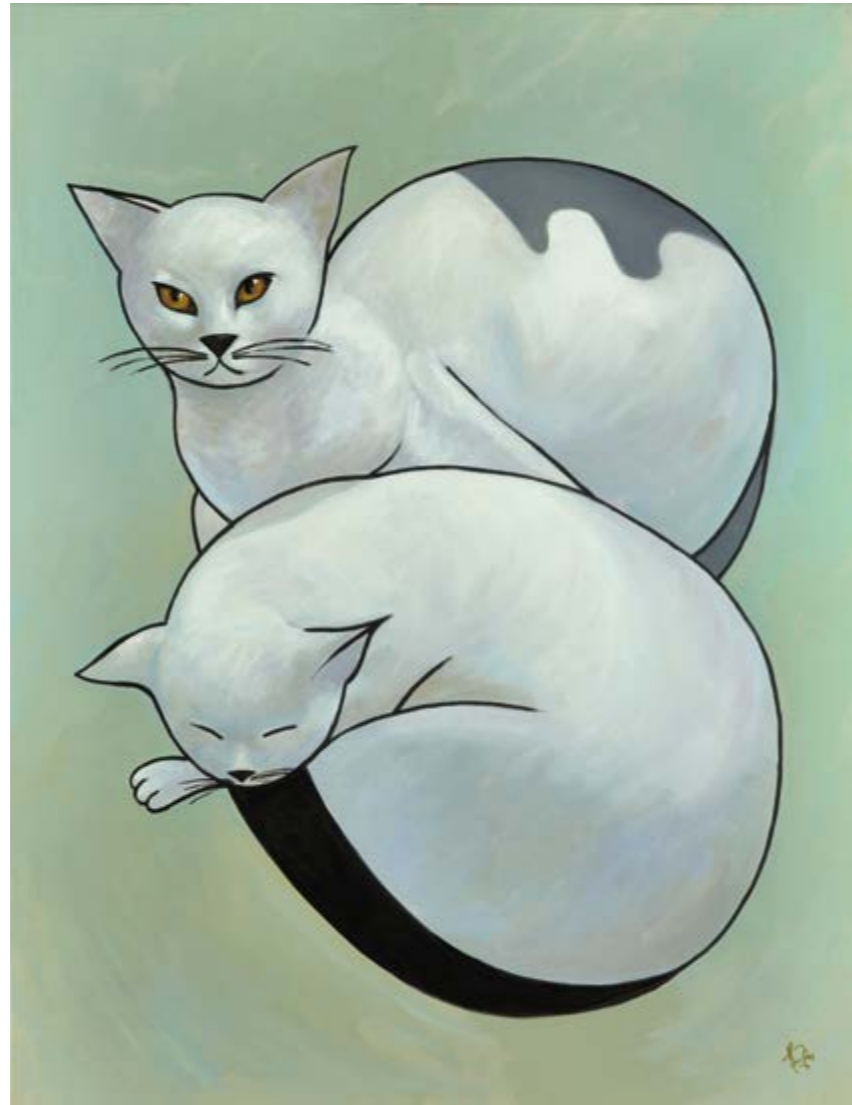
Discreció assegurada (Oli sobre tela, 116x89 cm.)