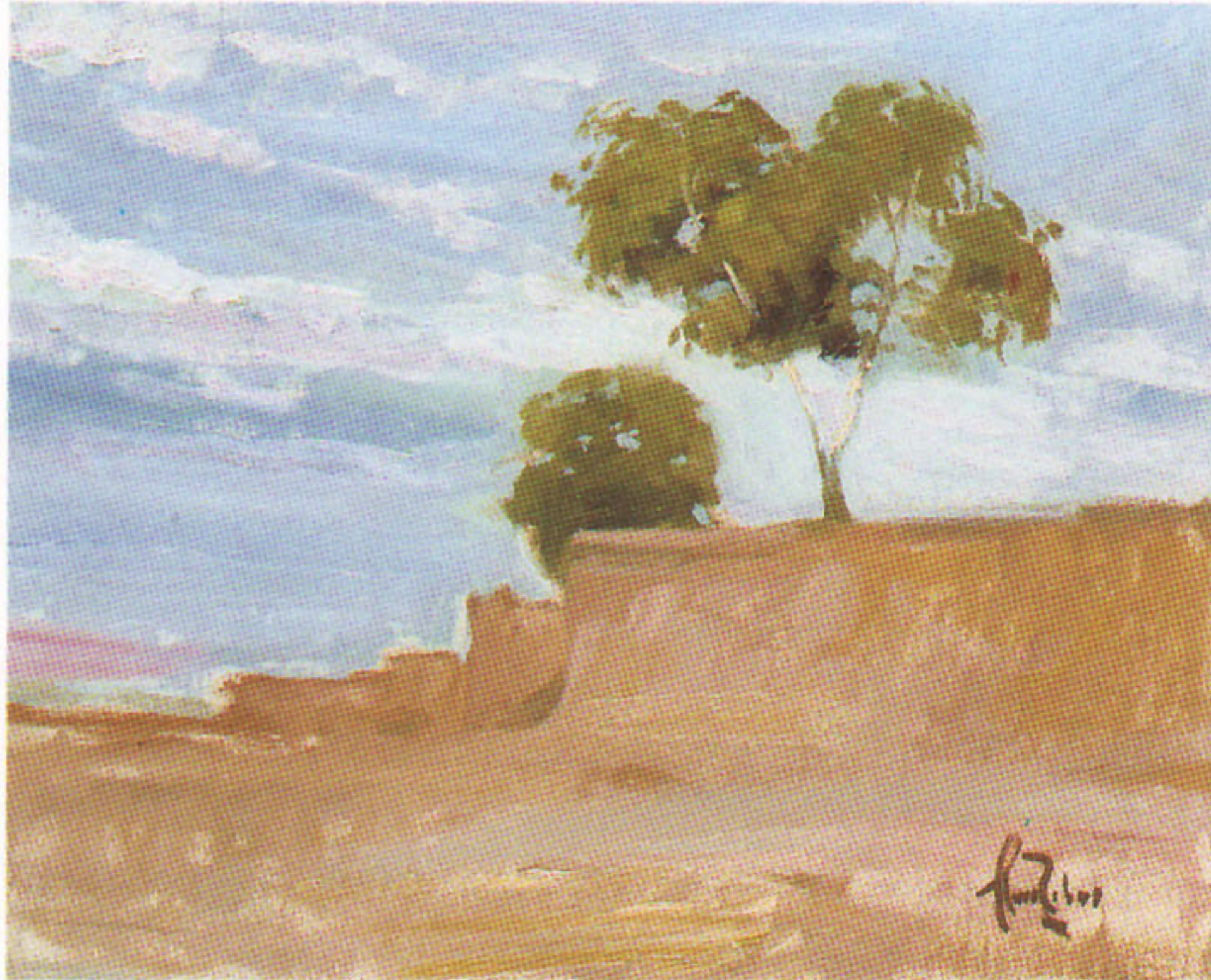
CAMINO DE MARRAKECH 27x22