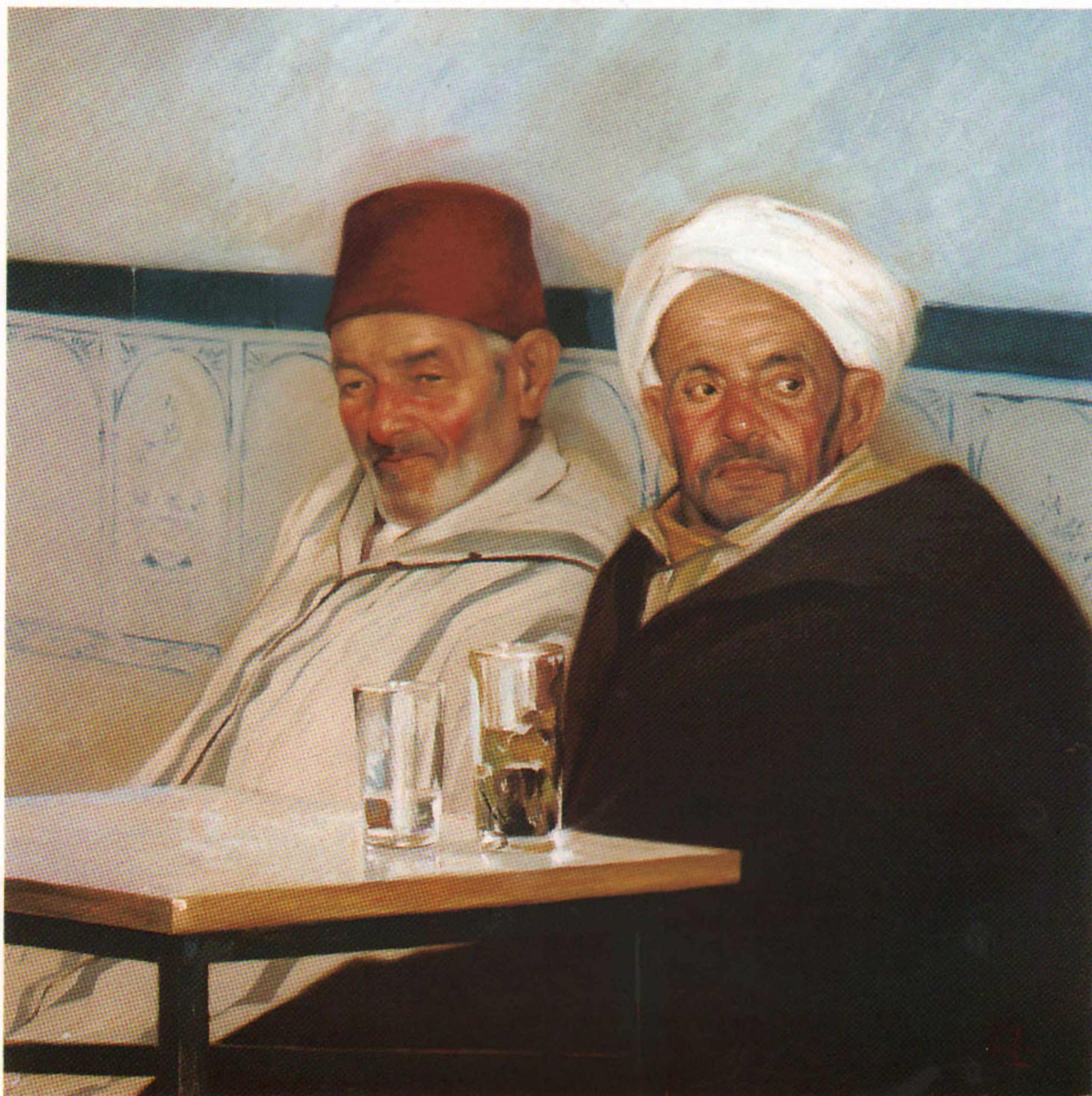
LA HORA DEL TE 60x60 cm.