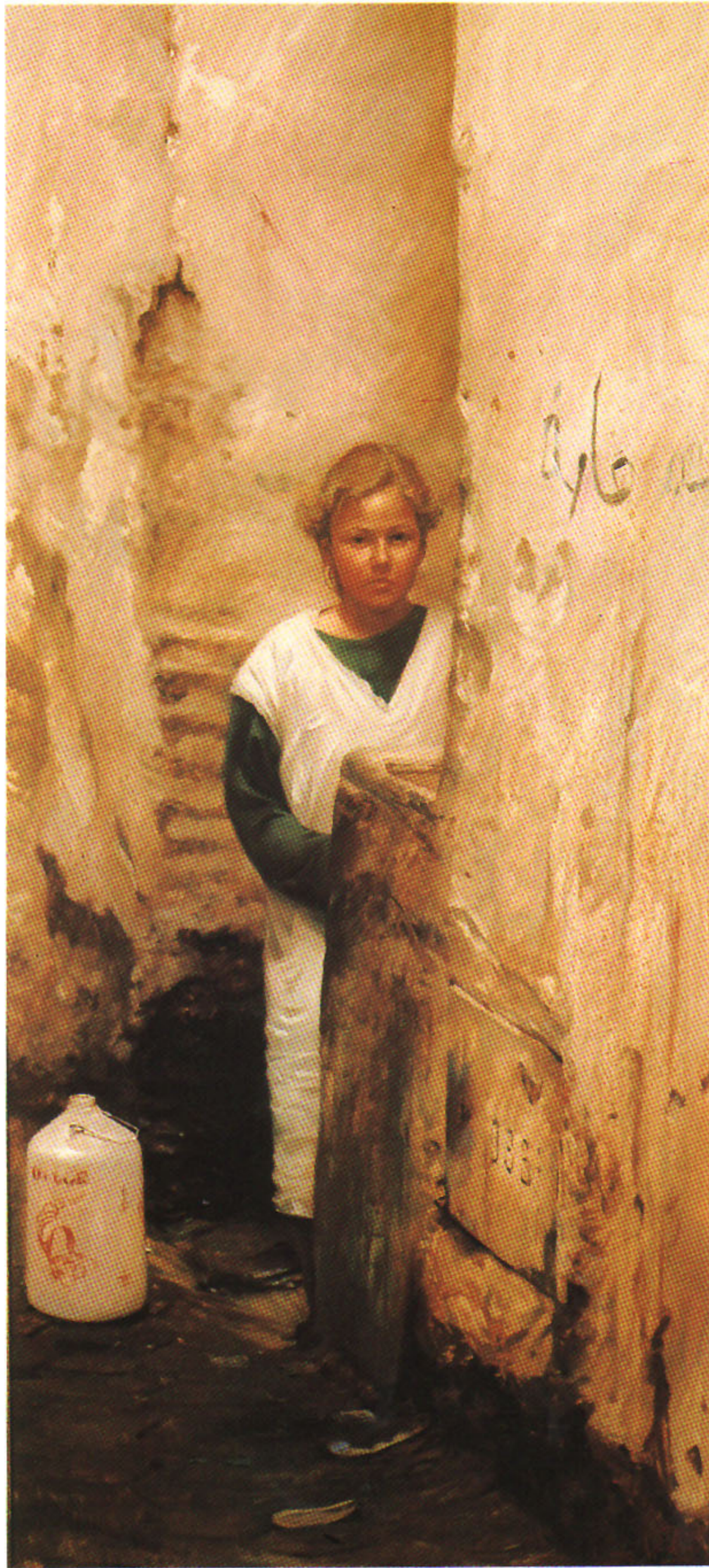
EN LA FUENTE 130x60 cm.