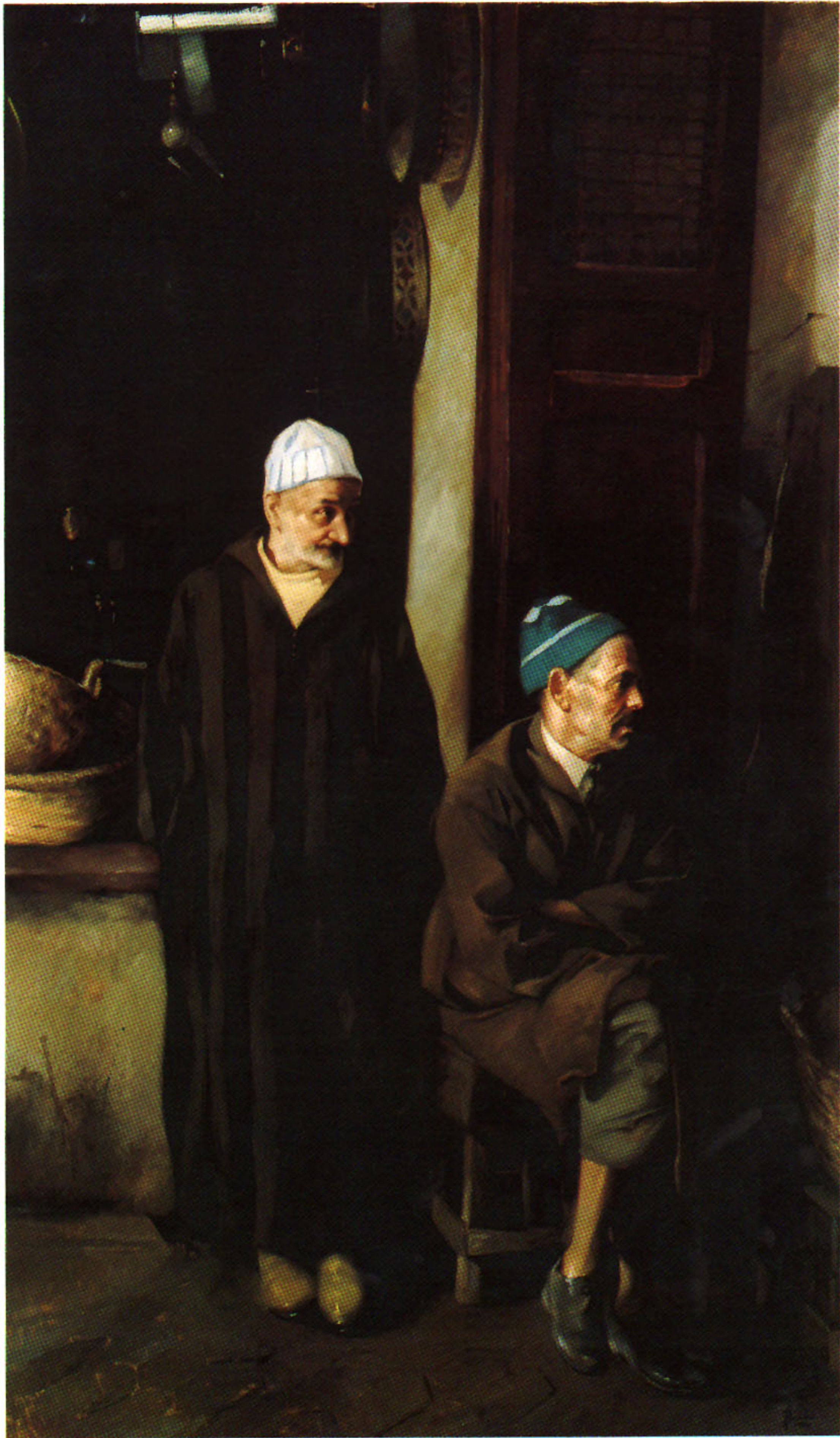
ESPERANDO AL CLIENTE 162x97 cm.