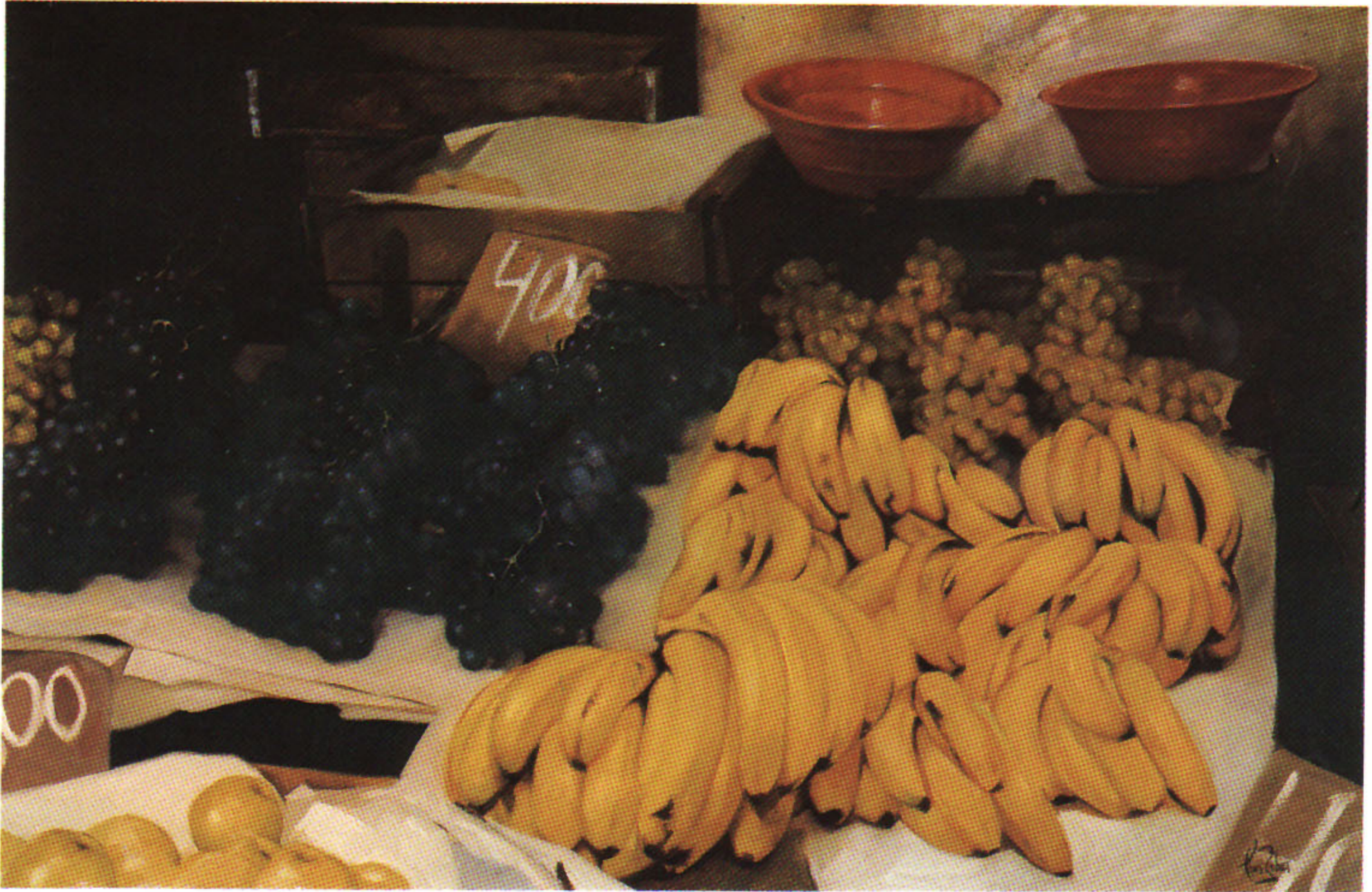
TIENDA DE MEKNES 92x60 cm.