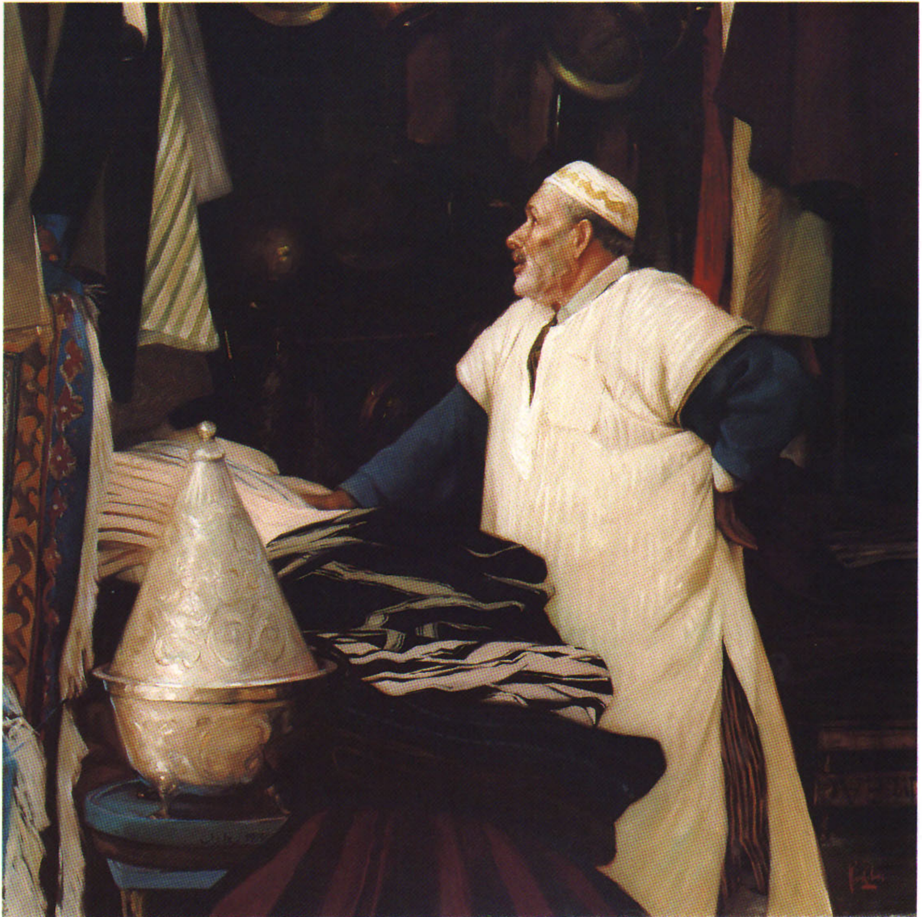
EL COMERCIANTE 100x100 cm.